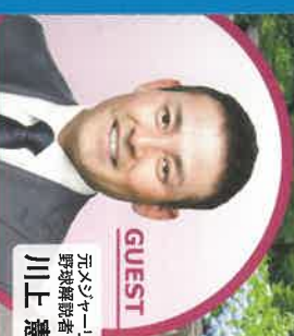
GUEST 元メジャーリーグ / 野球解説者 川上 憲伸さん

名古屋の街並みを見ながら、アフリカ学校給食支援のためのチャリティーウオークに参加しよう！