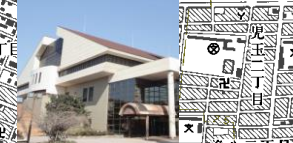
枇杷島スポーツ公園 WC