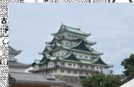
集合場所 名城公園 噴水前 WC